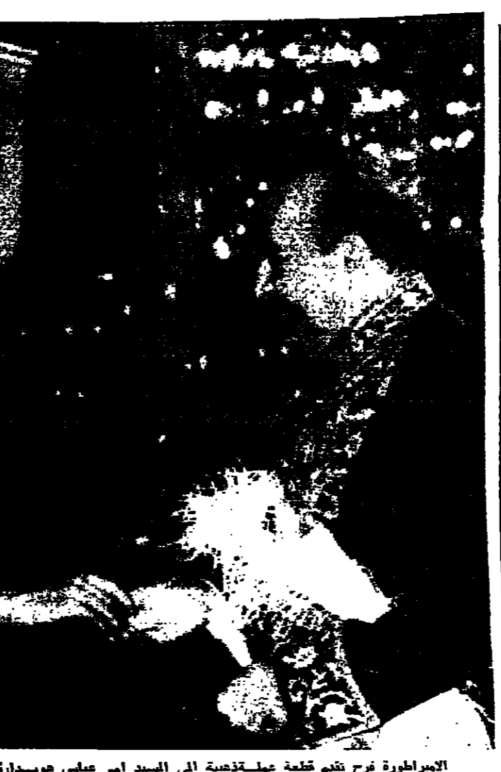
الامبراطورة فرج تقدم قلعة عمدة لزيارة السيد امير عيسى حيدر بن علي وزير ايران خلال الاحتفال بعيد الفريز والى جنبها جلالة القسام

شكر وعهد ال حدادين في المملكة الاردنية الهاشمية بجزيل شكرهم لكل من واسامهم بتقديمهم الشهيد سميج صالح حدادين